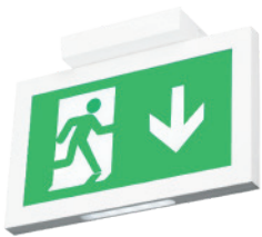
Montaje en Techo GX19 TBC