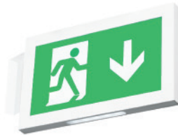
Montaje en Bandera GX19 TBC