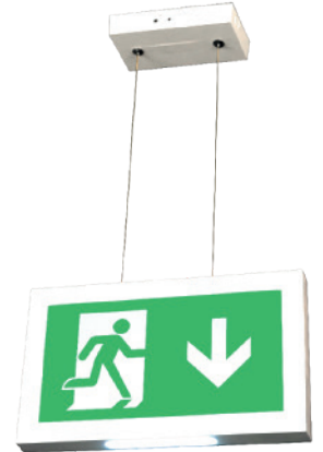
Montaje Colgado GX19 CBC