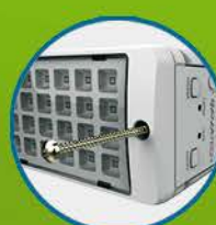
Agujeros pasantes para montaje en pared o techo